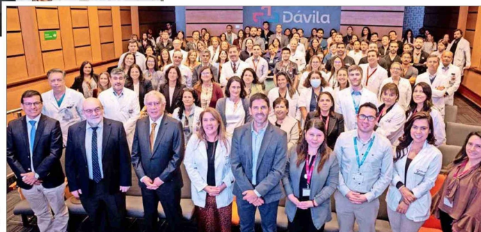
Red Dávila y Universidad de los Andes: 30 años de convenio docente.