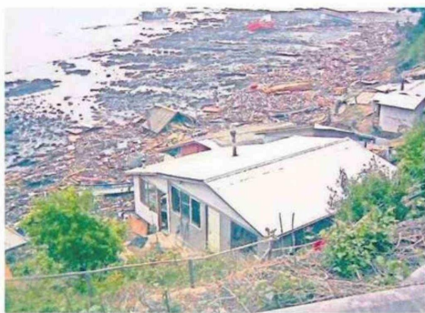
DICHATO QUEDÓ DEVASTADO TRAS EL 27/F.

lo ocultaron. Eso retrasó todo, sumado a la incertidumbre general".