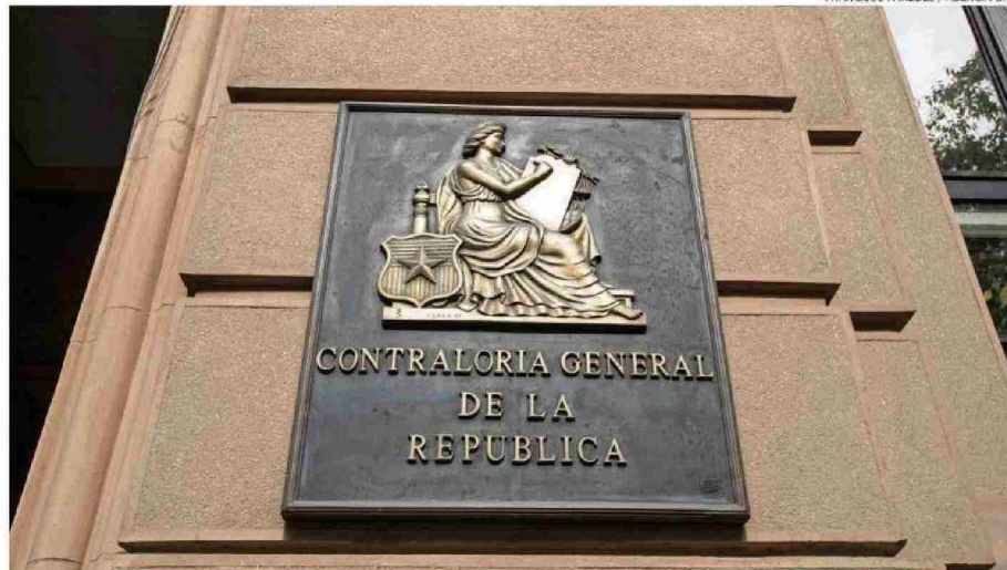
LA CONTRALORÍA REALIZÓ FISCALIZACIONES ENTRE 2023 Y 2024, LO QUE DERIVÓ EN “ESTIMACIONES SOBREDIMENSIONADAS DE INGRESOS”.

El ente fiscalizador destacó además “modificaciones de con-