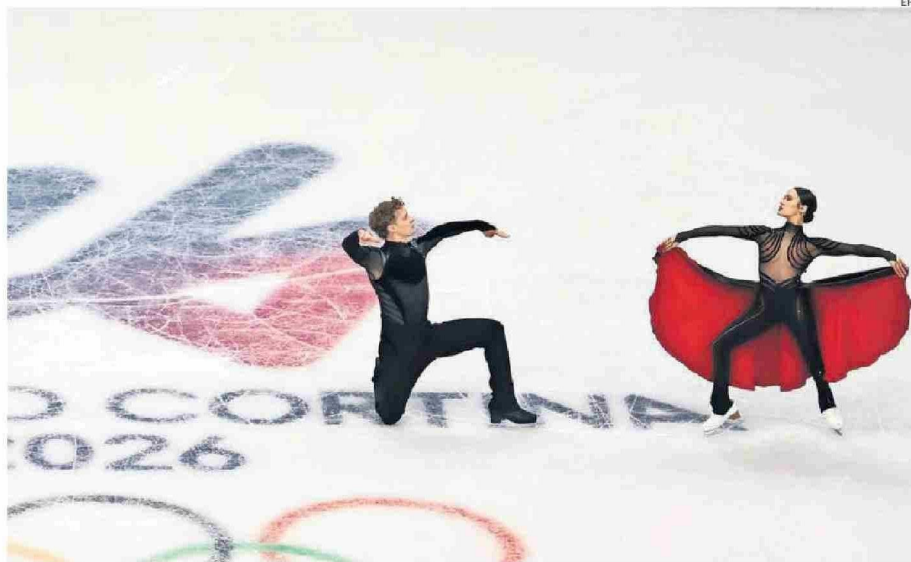
LOS JUEGOS DE MILÁN-CORTINA TIENEN 16 ESPECIALIDADES AGRUPADAS EN OCHO DEPORTES PRINCIPALES Y SEIS SEDES.

Como se dijo, el foco principal de hoy estará en el San Siro, pero será una inauguración descentralizada, ya que en paralelo habrán ceremonias en Cortina d'Ampezzo, Livigno y Predazzo. Para dar un tono distinto, habrá, además, dos pebeteros olímpicos que se encenderán hoy. Uno de ellos ubicado en el Arco della Pace de Milán