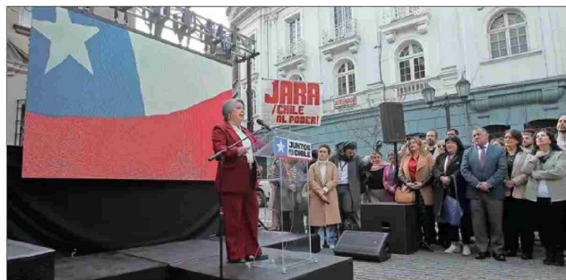
La candidata presentó su equipo oficial de voceros el lunes a las afueras de Londres 76.

Sin embargo, esta tarea está teniendo algunos baches en el camino, según indica parte de los involucrados. Esto, porque no existe una coordinación semanal o estratégica planificada