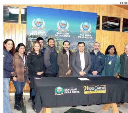
EL ACUERDO APORTA AL DESARROLLO RURAL DE SAN JUAN DE LA COSTA.