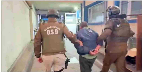
ATAQUES EN LA PRINCIPAL CARRETERA DEL PAÍS. — La indagatoria contra los miembros de la comunidad Temucú que vincula con atentados en la Ruta 5 Sur, entre otros ilícitos.