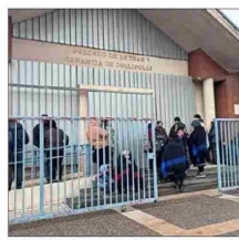
COLLIPULLI. — Hasta el tribunal llegaron familiares de los miembros de Temucú.

Uno de los detenidos en flagrancia quedó citado y el otro con firma mensual.