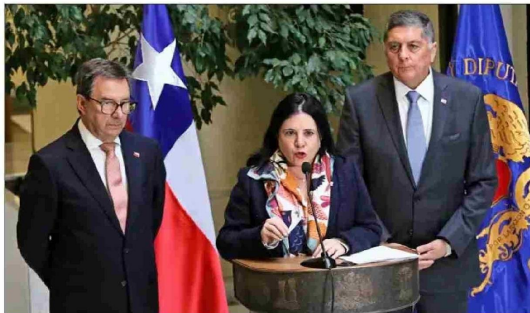
VOCEARÁ EN EL CONGRESO. — El titular de Defensa, Fernando Barros (izquierda), destacó la coordinación que su par de Seguridad, Trinidad Steiner, realizó en el operativo. Lo acompaña el ministro del Interior, Claudio Alvarado.