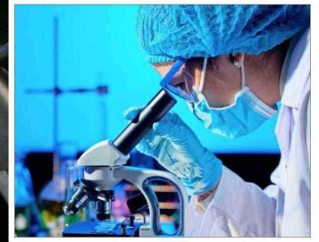
De las 181 postulaciones, solo 29 centros serán aprobados.

por 25 años. Además, hemos sostenido como comunidad que la renovación de los centros debe ser competitiva. Así se hace en Chile y el mundo".