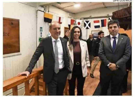
DELEGADA CARRASCO Y DIPUTADO VALENZUELA ACOMPAÑARON A MINISTRO.

mensuales es el aporte que se está entregando a los propietarios de taxis y colectivos por el alza internacional en el precio de los combustibles.