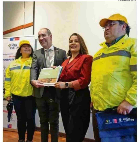
LA ALCALDESA AMTMANN PARTICIPÓ EN EL LANZAMIENTO DE LA ENCUESTA.

mente para contar con esa base sólida de información. Esperamos que, de aquí a marzo de 2027, podamos disponer de todos los resultados, lo que nos permitirá afinar nuestras decisiones y proyectar de mejor manera el desarrollo del sistema de transporte. Tenemos un compromiso con el Ministerio de Transportes; somos aliados en esta tarea. Parte de los recursos de la Ley Espejo llegan al Gobierno Regional, y sobre ellos debemos in-