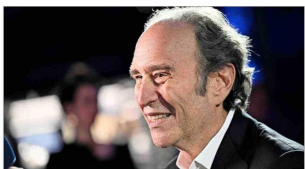
El francés Xavier Niel ha liderado un potente desarrollo de Millicom en la región.

A partir del ingreso del magnate francés Xavier Niel a la propiedad, la compañía de origen europeo inició una fuerte expansión en América Latina.