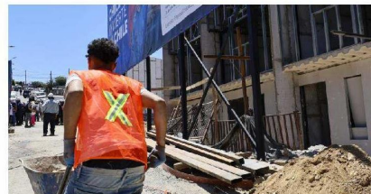
Demolición de casas en El Olivar queda en manos de la justicia tras ofensiva judicial contra el Ministerio de Vivienda y Urbanismo