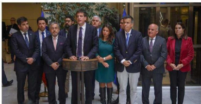
Bancada RN impulsa proyecto de ley para endurecer sanciones por secuestro ante avance del crimen organizado