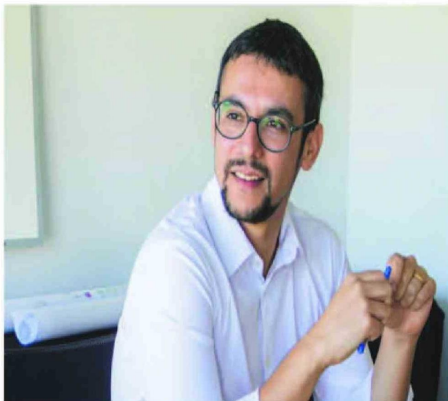
Miguel Concha , alcalde de Peñalolén, reveló que ha recibido varios mensajes amenazantes.

El alcalde reprochó que Chomali organizara una actividad en la comuna, pero al mismo tiempo le haya negado varias veces reuniones para abordar los problemas de la salud en Peñalolén.