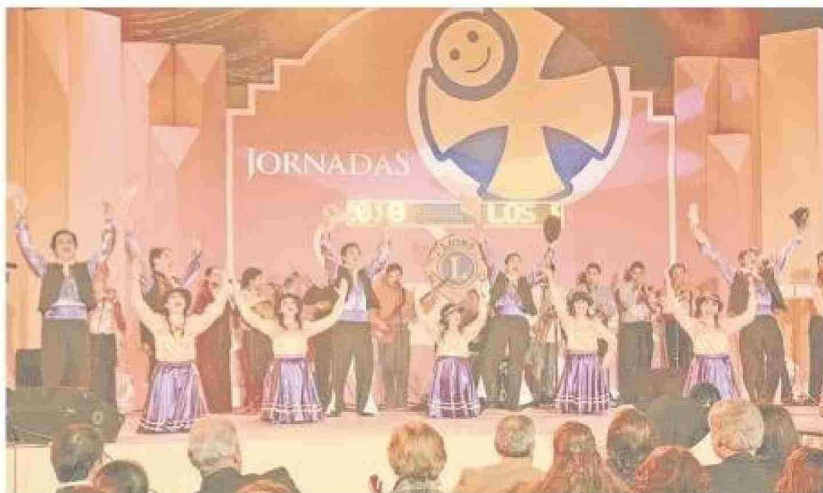
Los Ruiseñores en una presentación de las Jornadas por la Rehabilitación de Magallanes, en noviembre de 2010.

Tiraje: 3.000 Lectoría: 9.000 Favorabilidad: No Definida