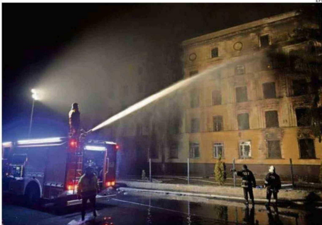
BOMBEROS UCRANIANOS EXTINGUEN UN FUEGO EN UN EDIFICIO ATACADO POR RUSIA.

sorprendió a todos al inicio de la noche del jueves cuando había aceptado su presencia en los bombardeos a capital ucraniana y ciudades del país vecino, sea por una semana. es solo frío. Es extraordinario. Hace un frío recordamos muy contentos aparte de todo, lo último necesitan (los ucranianos) que les caigan misiles a los pueblos y ciudades", expresó Trump. remplin confirmó ayer el presidente Trump se distanció al presidente para que se abstuviera una semana, hasta el 1 de febrero, de realizar ataques con el fin de crear condiciones favorables para la tregua de negociaciones. crítico hace unos días por pedir una tregua cuando el ejército no continúa martirizando la infraestructura civil rusa. ués de dar las gracias, Zelenski corroboró la tregua de ataques rusos. De la parte de guerra del río de Defensa ruso y informó ayer de ningún ataque a instalaciones. hubo ataques a instalaciones energéticas la pasada pero ayer (el jueves) arde nuestra infraestructura energética fue golpeada en regiones", dijo Zelenski.