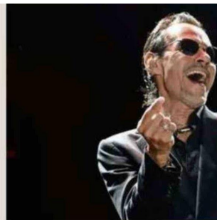
EL MÚSICO Y SU ESPOSA CONFIRMARON

La actividad se llevará a cabo con aporte voluntario y habrá dos modalidades para acceder, ya sea inscribiéndose en un formulario online (toda la información está disponible en la cuenta de Instagram @libro.cancionesdelviento) o bien llegar directo a la Plaza Victoria para disfrutar de la iniciativa. 🌟