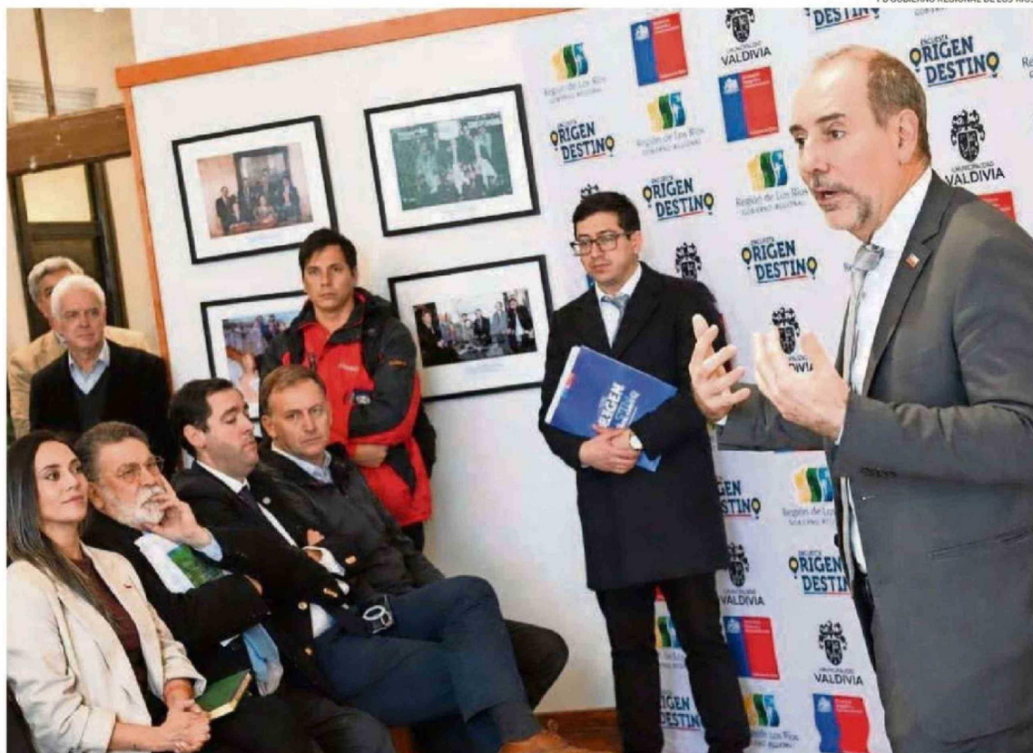
LOUIS DE GRANGE VISITÓ POR PRIMERA VEZ VALDIVIA Y PARTICIPÓ EN DIVERSAS ACTIVIDADES EN COMPAÑÍA DE AUTORIDADES LOCALES Y REGIONALES.

Aquello fue parte de una agenda que también consideró encuentros con autoridades regionales y un recorrido a las instalaciones donde funciona el Canal de Ensayos Aerodiná-