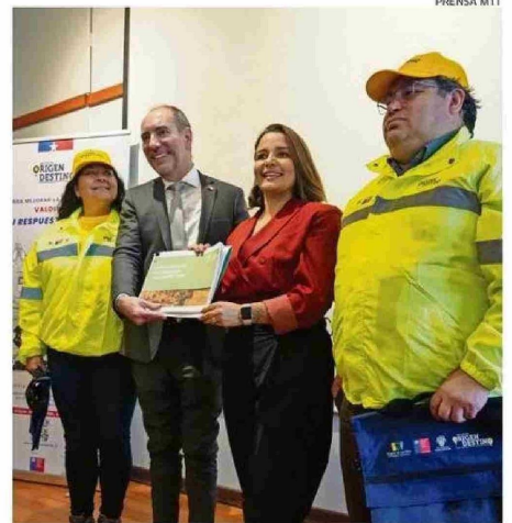
LA ALCALDESA AMTMANN PARTICIPÓ EN EL LANZAMIENTO DE LA ENCUESTA.

mente para contar con esa base sólida de información. Esperamos que, de aquí a marzo de 2027, podamos disponer de todos los resultados, lo que nos permitirá afinar nuestras decisiones y proyectar de mejor manera el desarrollo del sistema de transporte. Tenemos un compromiso con el Ministerio de Transportes; somos aliados en esta tarea. Parte de los recursos de la Ley Espejo llegan al Gobierno Regional, y sobre ellos debemos in-