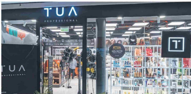
© Nueva tienda TUA Mall Parque Arauco.

La apertura de esta sucursal refuerza el posicionamiento de TUA como referente en el mundo de la belleza, ofreciendo no solo productos de primer nivel, sino también un servicio cercano y especializado. Con esta expansión, la cadena reafirma su compromiso: “TUA es tu lugar de belleza”.