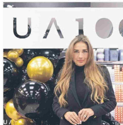
© Carola de Moras, rostro oficial de TUA.