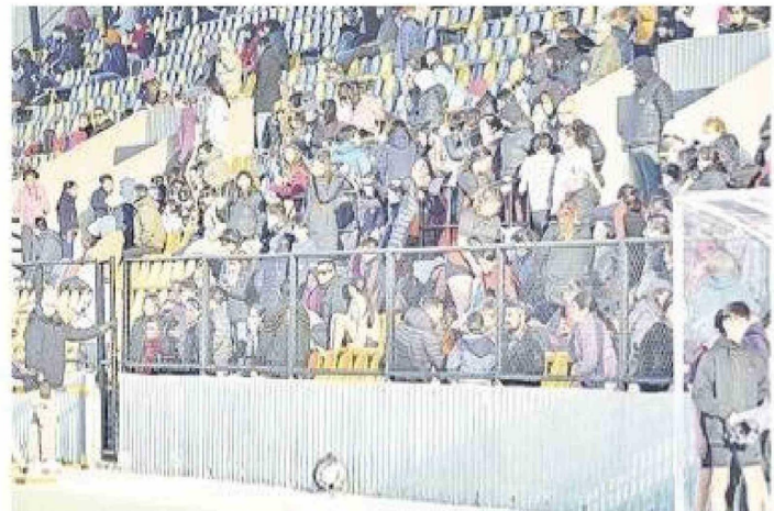
El público apoyó en gran cantidad a los deportistas durante su participación de ayer.