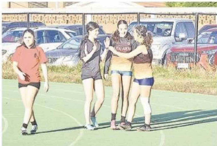
Más de 200 atletas, entre primero básico y cuarto medio, se reunieron en las instalaciones del estadio Fiscal.

Además, destacó el entusiasmo de los estudiantes y las familias presentes durante la jornada. "Los chicos están muy motivados este año y se nota que hay mucho interés, especialmente en las pruebas de velocidad", concluyó.