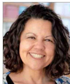
La psicóloga es directora ejecutiva de Grupo Educativo y presidió el consejo asesor de la Agencia de Calidad de la Educación.