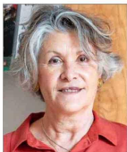
La profesora preside el Consejo Nacional de Educación (CNE).