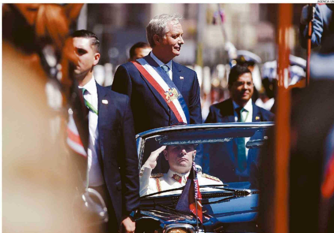
DESDE SOSTENER EL MENSAJE DE CAMPAÑA HASTA RECONOCER ERRORES SON ALGUNAS DE LAS TEMÁTICAS QUE PODRÍAN ABORDARSE EN ESTA PRIMERA CUENTA PÚBLICA DE KAST.

En el caso del segundo gobierno de Sebastián Piñera, recuerda el académico, "la atención estuvo puesta en torno a las diferencias con los logros alcanzados por Michelle Bachelet y la preocupación sobre la situación económica. Por su parte, Gabriel Boric orientó su discurso a las demandas expresadas en el estallido social y las esperanzas que despertaba el pri-