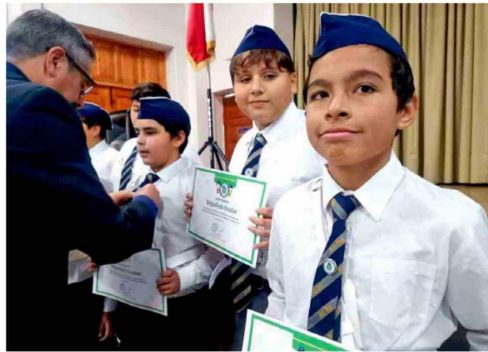
La comunidad educativa del Colegio Moisés Mussa encabezó jornada de reflexión y aprendizaje en torno a la cultura preventiva frente a emergencias socio-naturales.

Además, la legislación mandata al Ministerio de Educación a incorporar acciones pedagógicas en los planes de estudio destinadas a fortalecer la conciencia de riesgo, la prevención y el desarrollo de conductas de autocuidado frente a desastres socio-naturales. Desde el Colegio Moisés Mussa señalaron que esta actividad reafirma el compromiso del establecimiento con la formación integral de sus estudiantes, impulsando una educación que, junto con entregar conocimientos, fomente habilidades y actitudes responsables para enfrentar emergencias, contribuyendo a la construcción de comunidades más seguras y resilientes.