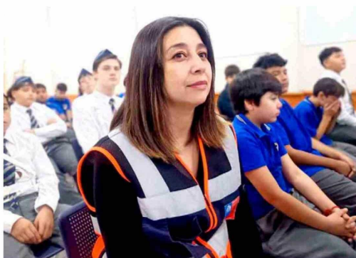
Durante la jornada, autoridades y comunidad educativa reflexionaron sobre la importancia de aprender de las catástrofes naturales ocurridas en el país.

LA ACTIVIDAD REUNIÓ A AUTORIDADES, ORGANISMOS DE EMERGENCIA Y COMUNIDADES EDUCATIVAS PARA FORTALECER LA CULTURA PREVENTIVA Y RELEVAR LA IMPORTANCIA DEL AUTOCUIDADO FRENTE A SITUACIONES DE RIESGO.