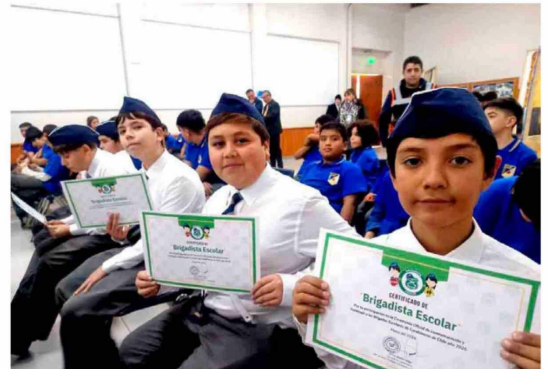
Integrantes de las brigadas escolares recibieron un reconocimiento por su compromiso con la seguridad y bienestar de sus comunidades educativas.