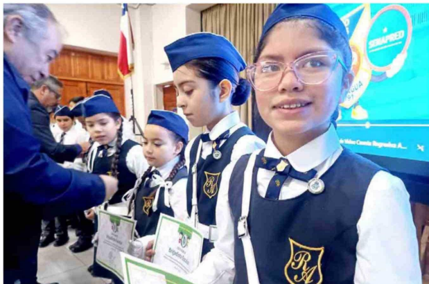
La actividad reunió a estudiantes en una instancia orientada a fortalecer comunidades escolares más preparadas y resilientes.

Con una jornada marcada por la reflexión, la prevención y el compromiso con la seguridad escolar, el Colegio Moisés Mussa fue sede de la conmemoración del Día Nacional de la Memoria y Educación sobre Desastres Socio-Naturales, instancia instaurada por la Ley N° 21.454, que establece cada 22 de mayo como una fecha para promover la conciencia frente a los riesgos y recordar a las víctimas del histórico terremoto de Valdivia de 1960.