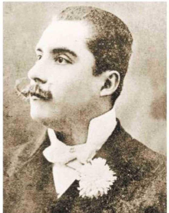
Una de las imágenes más conocidas de José Santos Chocano (1875-1934), prolífico autor peruano fallecido trágicamente en Chile.

En los seis años que duró su estadía en Chile, Santos Chocano vivió con gran austeridad, a menudo con di-