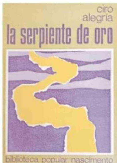
Portada de una de las últimas impresiones realizadas por la editorial Nascimento de la primera novela de Ciro Alegria.