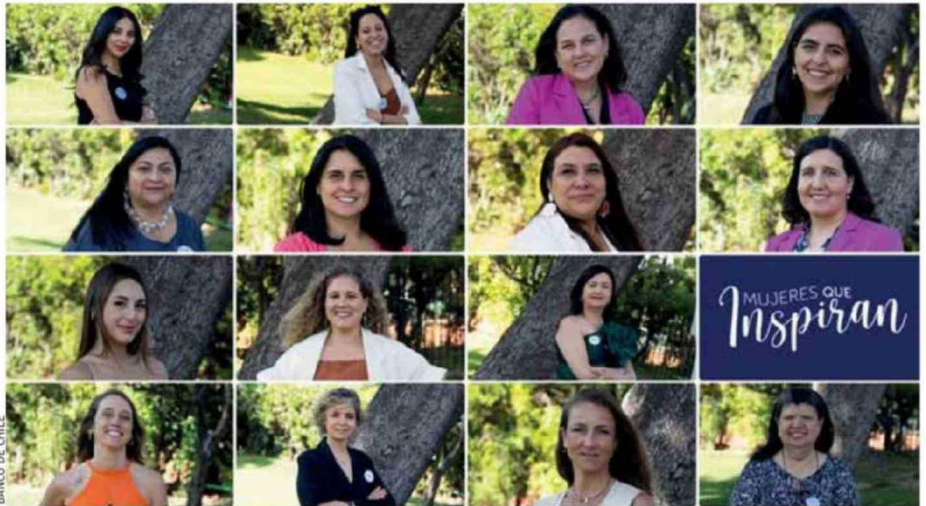
La edición 2025 de Mujeres que Inspiran cerró su convocatoria con un récord de 1.503 postulaciones de todo el país.

“En Banco de Chile estamos convencidos del impacto decisivo que tienen las mujeres en el desarrollo sostenible de nuestra sociedad. A través de la sexta edición de Mujeres que Inspiran, buscamos promover, apoyar y destacar a quienes están impactando su entorno y aportando, desde su trayectoria personal y laboral,