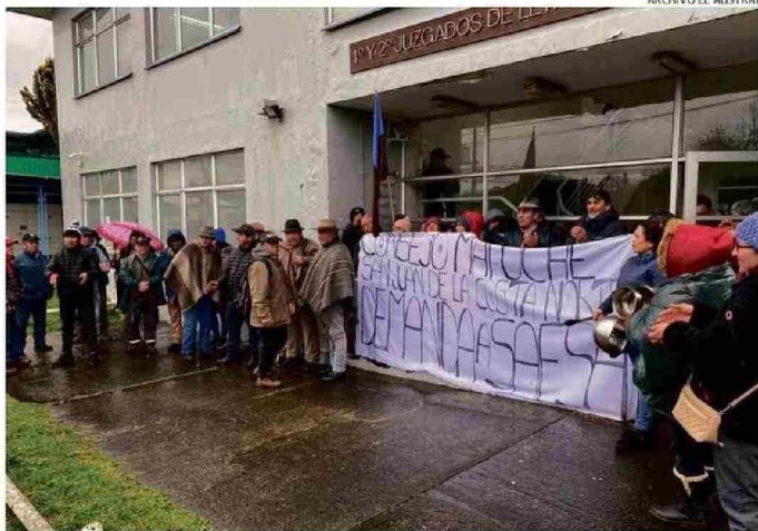
EN EL AÑO 2024 LAS FAMILIAS DETERMINARON PRESENTAR LA ACCIÓN LEGAL EN CONTRA DE SAESA.