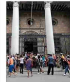
A la falta de electricidad y combustible en Cuba se suma la escasez de efectivo en los bancos, como lo atestiguan las largas colas, principalmente de personas mayores, que por horas se agolpan ante las sucursales. | A 6

> La rectora Rosa Devés advierte sobre la polarización, "que tiende a reducir al otro a un adversario antes que a un interlocutor legítimo. Esta dinámica se expresa en la radicalización del debate público y en una progresiva pérdida de la escucha". | C 1