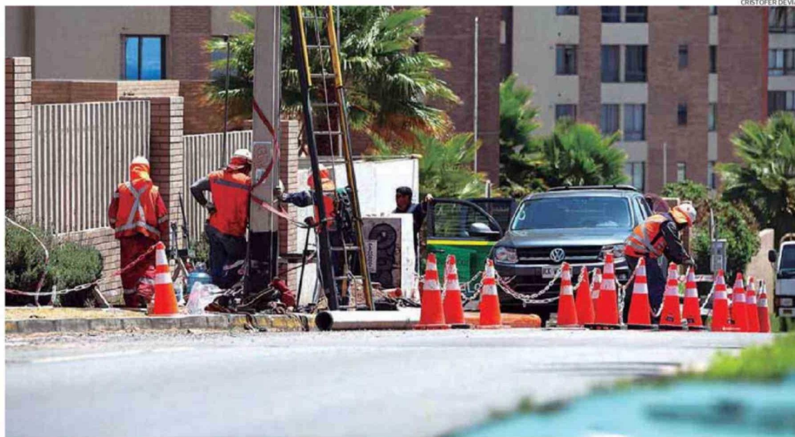
BRIGADAS TÉCNICAS REALIZARON AYER LAS EVALUACIONES EN TERRENO PARA DETERMINAR LAS CAUSAS DE LA EXPLOSIÓN.