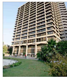
El nuevo MUT que se evalúa en el edificio de Enel, tiene lugar importante en su agenda.

Otra prioridad es relicitar el centro de eventos Castillo Hidalgo, licitación declarada desierta en tres oportunidades; recuperar para la comuna el festival Lollapalooza, y, ya estuvo con el corredor de autos Nico-