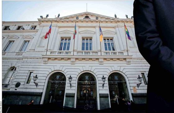
El nuevo alcalde de Santiago, Mario Desbordes.

Además de la ministra del Interior —a quien ya visitó en La Moneda— y la subsecretaria de Prevención del Delito, el nuevo