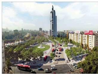
Un apoyo decidido dará al proyecto de Nueva Alameda.