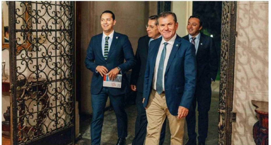
► La reunión de Cerro Castillo partió a las 8.30 de la mañana del miércoles.