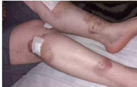
ALGUNOS TRABAJADORES HAN SIDO MORDIDOS EN AMBAS PIERNAS.

al mes reportan desde la empresa que ejecuta los trabajos de limpieza en la ciudad, donde principalmente las víctimas son los auxiliares de aseo que retiran las bolsas de las casas.