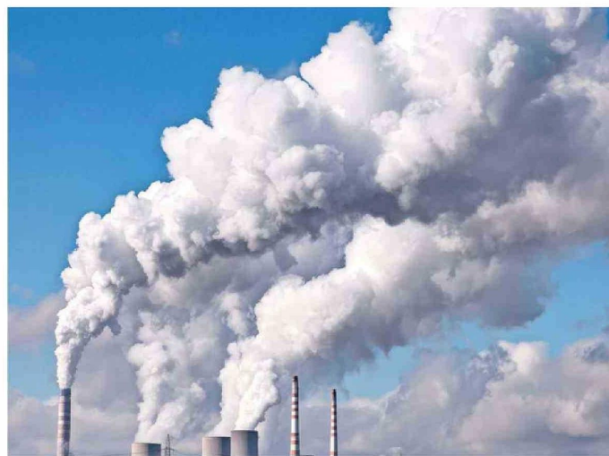
En Chile, millones de personas aún viven en ciudades donde el aire supera frecuentemente los niveles recomendados por la OMS.

Marcelo Mena, exministro de Medio Ambiente y académico de la Pontificia Universidad Católica de Valparaíso (PUCV), admite que hay preocupación por este tema, principalmente porque "tenemos más de la mitad de los días de invierno en Santiago con un aire insa-