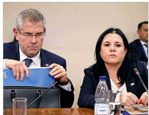
En virtud de las ausencias del Ministerio de Seguridad, la sesión se extendió por solo 20 minutos de las dos horas que inicialmente tenía programadas.

■ Macaya: "Es un proyecto que no conocemos" Desde la UDI, el presidente de la comisión, el senador Javier Macaya, sostuvo que "no tengo que explicar la importancia que tiene la carrera de Carabineros, el tema de seguridad, la temática que ha levantado nuestro país como una de las principales preocupaciones, y para mí es evidente que el Ministerio de Seguridad tiene que venir a presentar este proyecto, es un proyecto que viene de la administración anterior; el Ejecutivo tomó una determinación de ponerle su urgencia, hay una definición política detrás de respaldar este proyecto, pero es un proyecto que no conocemos en la comisión". En esa línea, el legislador sostuvo que "hubiésemos po-