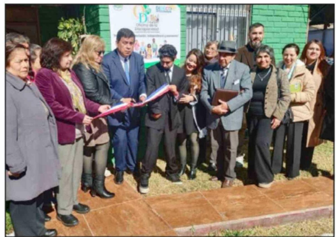
El corte de cinta marcó el inicio oficial del nuevo espacio destinado a fortalecer la inclusión y la atención integral de personas con discapacidad en la comuna.

Asimismo, explicó que la oficina desarrollará un trabajo interdisciplinario y comunitario a través de distintas áreas de intervención, entre ellas rehabilitación integral comunitaria, tránsito a la vida independiente, visitas domiciliarias, orientación social, talleres de habilidades laborales, estimulación cognitiva, actividad física adaptada y