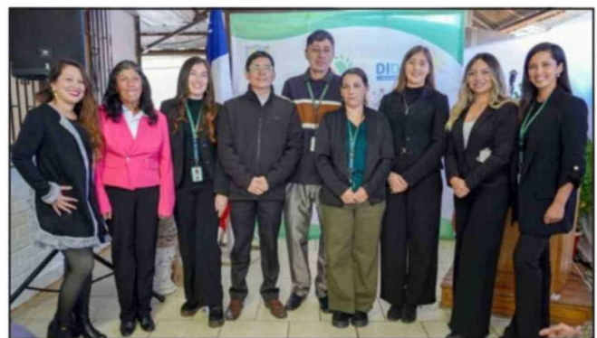
La nueva oficina desarrollará un trabajo interdisciplinario enfocado en la rehabilitación, orientación social y vinculación comunitaria.