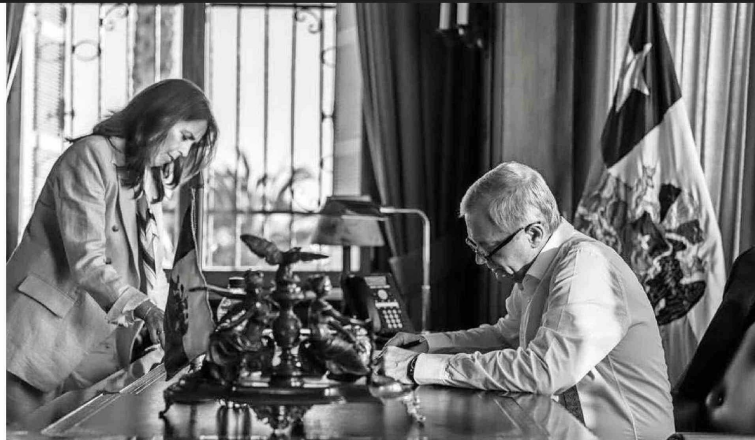
En sus dos primeros meses, Kast duplica las actividades públicas hechas por su antecesor, Gabriel Boric.

La defensa de Palacio tendrá un respaldado en la agenda. Según una comparación interna de actividades presidenciales entre los primeros meses de Gabriel Boric y José Antonio Kast, el actual mandatario registra 196 actividades públicas entre el 1 de marzo y el 7 de mayo, frente a 88 de Boric entre el 11 de marzo y el 11 de mayo (ver infografía). También registra 37 lugares distintos, casi el doble que los 19