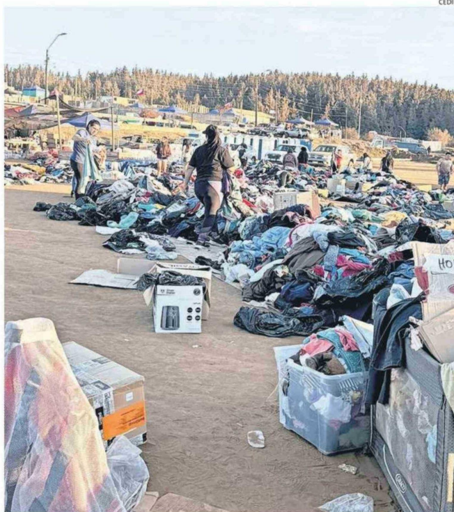
ESTE ERA EL PÁNOGRAMA EN PUNTA DE PARRA DURANTE EL FIN DE SEMANA CON LA ROPA ACUMULADA.

"La respuesta humanitaria tiene que ser digna y para eso deben velar las instituciones del Estado, supuestamente especializadas. Considerando la gestión de emergencias contemporáneas hay elementos sumamente preocupantes a esta altura de desarrollo de nuestro país", concluyó.