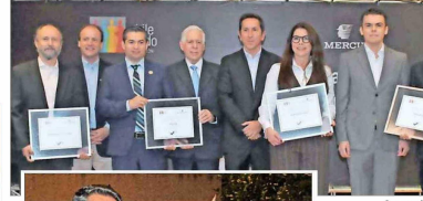
Grupo de empresas ganadoras del Sello de Distinción: Universidad Alberto Hurtado, OCG Chile, Grupo Guante-Gacal y Statkraft Chile.