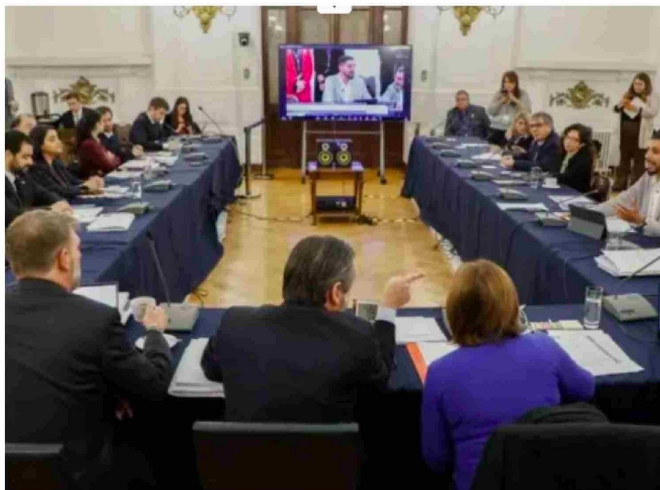
Tras un inicio marcado por demoras y tensión, el debate continuó ayer miércoles.

Asimismo, la instancia dio luz verde a un nuevo "crédito tributario para pymes" que paguen remuneraciones. En concreto, las micro, pequeñas y medianas empresas podrán acceder a un beneficio equivalente al 15% de las remuneraciones mensuales pagadas por trabajador, considerando sueldos de hasta 7,8 UTM. No obstante, esta medida no será aplicable a empresas del Estado ni a aquellas con participación estatal superior al 50%.