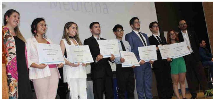
Un segundo grupo recibió su título de médicos de la UOH.

Otros siete nuevos médicos y médicas recibieron su título.