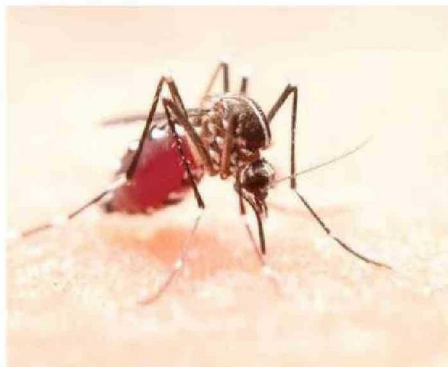
POR LA APARICIÓN DE ZANCUDOS QUE TRANSMITAN ENFERMEDADES COMO DENGUE O MALARIA.