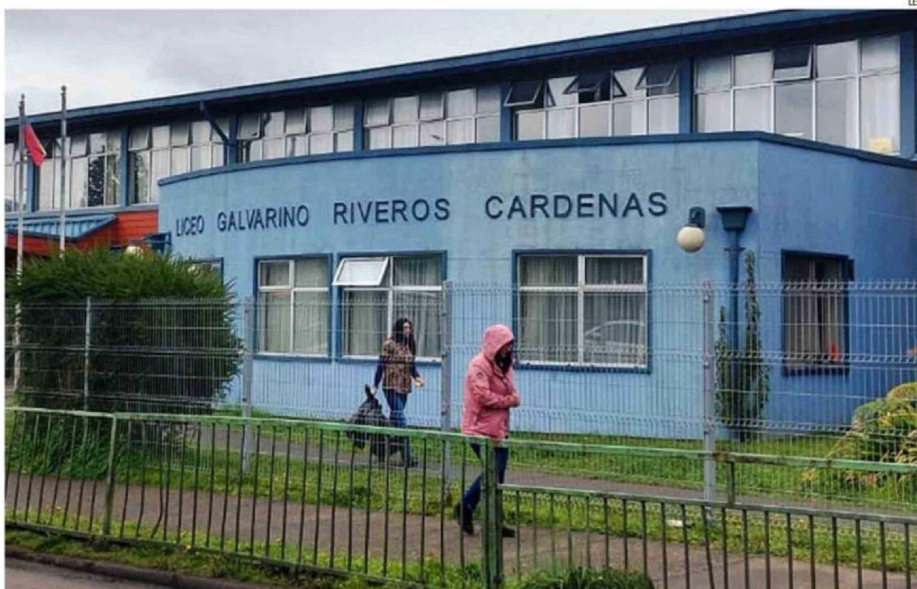
DESDE EL MEDIODÍA DE AYER SE SUSPENDIERON LAS ACTIVIDADES LECTIVAS EN EL TRADICIONAL ESTABLECIMIENTO CASTREÑO.