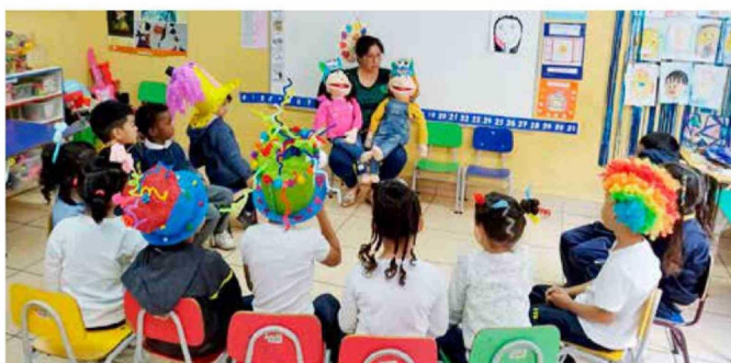
Poner aprendizaje socioemocional al centro del currículum es un factor clave y determinante.

“Las familias tienen un rol enorme. Pero el problema no se resuelve culpabilizándolas. Una mamá que llega a las nueve de la noche del trabajo y se encuentra con un adolescente conectado todo el día no necesita que el colegio le diga lo que ya sabe. Necesita orientación práctica, no juicio. Lo que mejor ha funcionado, y la evidencia internacional lo respalda, es trabajar con los apoderados desde la prevención, con lenguaje claro y herramientas concretas: cómo conversar con un hijo en crisis, cómo establecer límites con las pantallas, cómo leer las señales tempranas. Cuando la escuela ofrece eso, la familia se acerca. Cuando la escuela acusa, se aleja”.