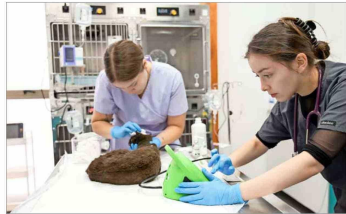
Alumnos voluntarios de la UNAB sede Concepción-Talcahuano brindan atención veterinaria gratuita a perros y gatos afectados por el fuego.

“Estamos recibiendo una alta demanda de pacientes. Muchos de ellos son ambulatorios, lo que es positivo, porque presentan quemaduras de carácter superficial”, señala Poblete. Hoy solo quedan ocho animales hospitalizados (cinco perros y tres gatos), los que se mantienen en condiciones estables. “Vamos a seguir trabajando hasta que termine la contingencia de los incendios”, asegura