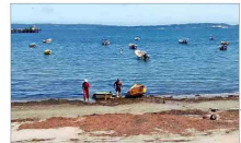
Sin recolección de mariscos y anclados al fondo del mar, se mantenían ayer los botes y lanchas.

Asimismo, la U. de los Andes ha creado un sitio web para recolectar fondos que irán en ayuda de los damnificados. Se puede donar en uandes.donando.cl.