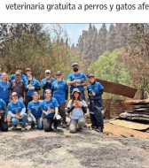
La U. de Concepción tiene a más de 500 voluntarios en terreno. La mayoría está realizando limpieza de escombros.