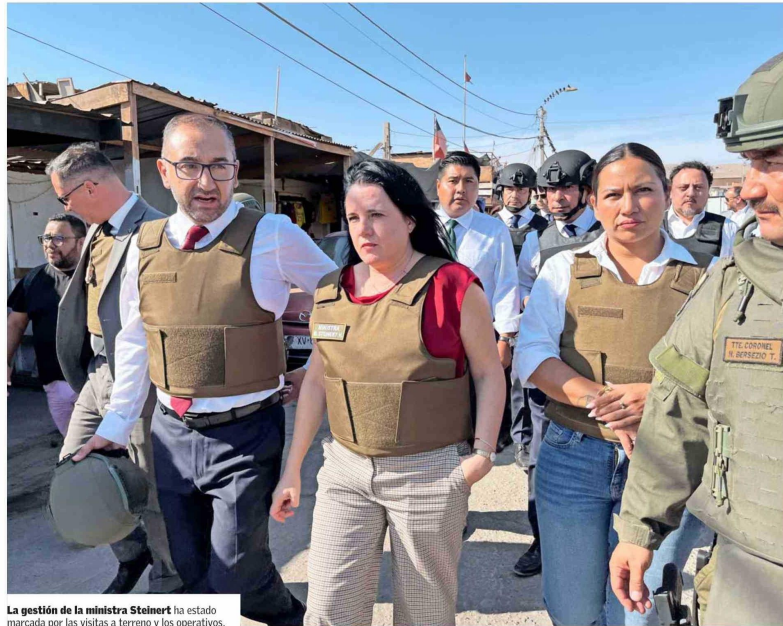
La gestión de la ministra Steiner ha estado marcada por las visitas a terreno y los operativos.

En concreto, cuentan que desde hace semanas se viene preparando un anuncio —tal