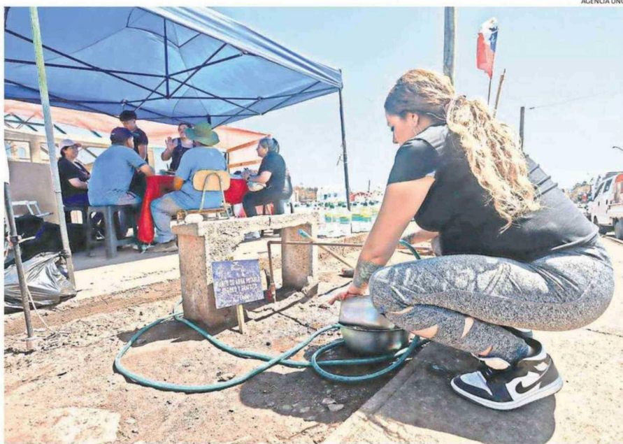
ESTADO DE CATÁSTROFE GENERA DUDAS EN LOS VECINOS RESPECTO AL PAGO DE CUENTAS BÁSICAS.