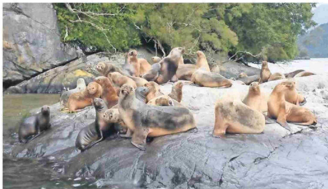
EL TRABAJO COLABORATIVO ASPIRA A ANTICIPAR INFORMACIÓN CLAVE PARA LA TOMA DE DECISIONES.