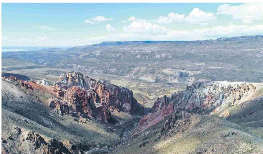
ESTE ESFUERZO EN LA ZONA SUBANTÁRTICA UNE ESFUERZOS PÚBLICOS, PRIVADOS Y CONSIDERA A LA SOCIEDAD CIVIL.