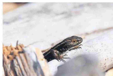
ESTE TERRITORIO TIENE CARACTERÍSTICAS ÚNICAS EN EL MUNDO.

del país y alberga una de las mayores superficies de áreas naturales protegidas, reforzando su importancia para la conservación de la biodiversidad y la investigación científica.