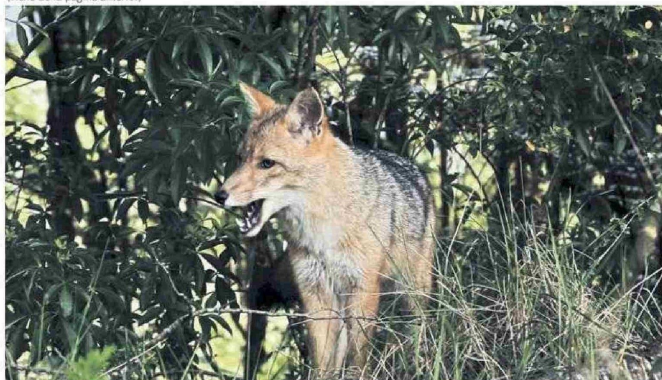
BOSQUES Y TURBERAS SON ESTUDIADOS EN EL TERRITORIO QUE ALBERGA A ESTE LABORATORIO.