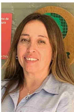
SANDRA GACITÚA, directora del Instituto Forestal (Infor).

"Este año estamos desplegando un intenso cronograma de actividades que buscan seguir conectándonos con la comunidad local y siendo un aporte concreto a conversaciones que son siempre necesarias y útiles. La idea es buscar puntos de encuentro y llegar a acuerdos respecto de temáticas que tienen un objetivo común: la búsqueda de una mejor calidad de vida para todos los habitantes de los territorios locales", detalló.