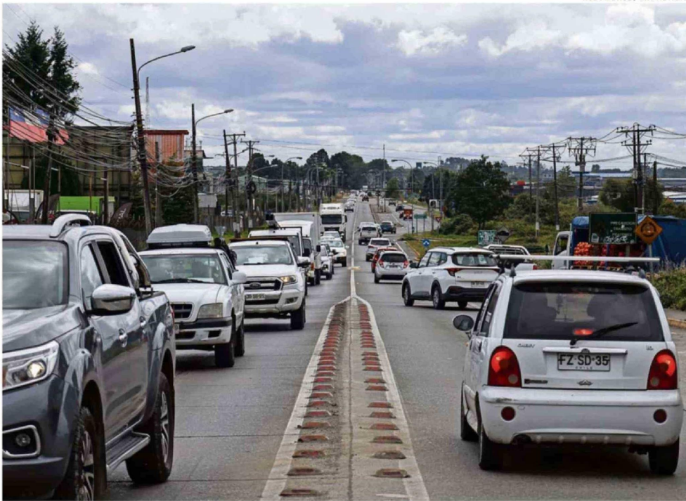
EL SECTOR NORPONIENTE DE PUERTO MONTT HA EXPERIMENTADO UN CRECIMIENTO DEMOGRÁFICO EXPLOSIVO, EN EL QUE LA RUTA EL TEPUAL ES CLAVE.