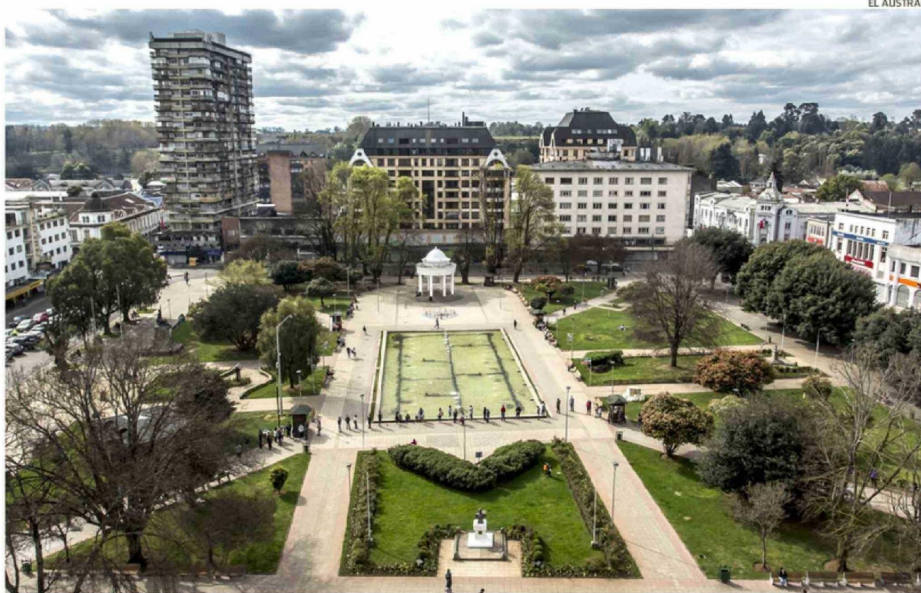
EL PROYECTO DE ESTACIONAMIENTOS SUBTERRÁNEOS ESTABA EMPLAZADO A LOS COSTADOS DE LA PLAZA DE ARMAS, EN LAS CALLES O'HIGGINS Y MATTA.

OSORNO. La iniciativa fue licitada dos veces en 2009 y 2011 para la construcción mediante concesión y después en 2023 y 2024, por la Ley de Financiamiento Urbano Compartido (FUC) del Ministerio de Vivienda (Minvu), todas sin éxito. Ahora no hay nada en carpeta del municipio o intención de alguna empresa, sumado a que ya no se puede optar con el mismo proyecto al FUC. Los usuarios dicen que faltan espacios en el centro.