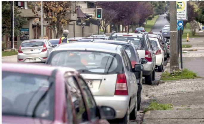
EL ACTUAL PARQUE AUTOMOTRIZ DE OSORNO SUPERA LOS 50 MIL VEHÍCULOS.