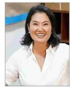
Candidata muestra una baja de 22 puntos en su imagen negativa desde febrero pasado.

CON CINCO VOTOS OFICIALISTAS, LA IZQUIERDA INTRODUCE LA SALA CUNA UNIVERSAL | C 4