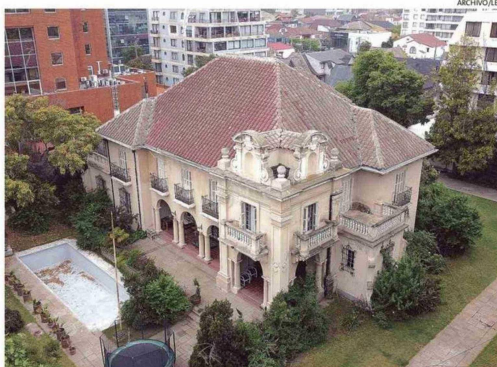
CASA LOSADA FUE REMATADA POR MÁS DE 3 MIL MILLONES Y ESTÁ A NOMBRE DE LA PUCV DESDE 2025.

Cuevas también apuntó a un eventual vicio en la firma de la escritura: "Estamos demandando por nulidad de contrato porque el abogado del banco