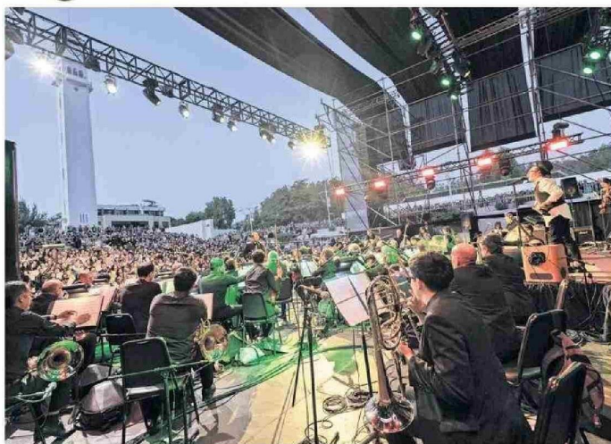
La instancia abierta al público busca construir un relato amplio, que pueda integrar todas las disciplinas que convergen en la UdeC, desde la música con la Orquesta Sinfónica, hasta los talleres y charlas.

"No había mucha vuelta que dar. Había que cambiar el switch